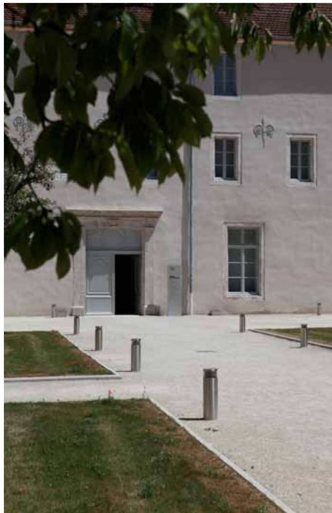
■ Cour du musée

pédagogiques pour apprendre en s'amusant. Le musée met son dynamisme au service de la découverte du patrimoine archéologique et historique du pays Châtillonnais pour tous les publics.