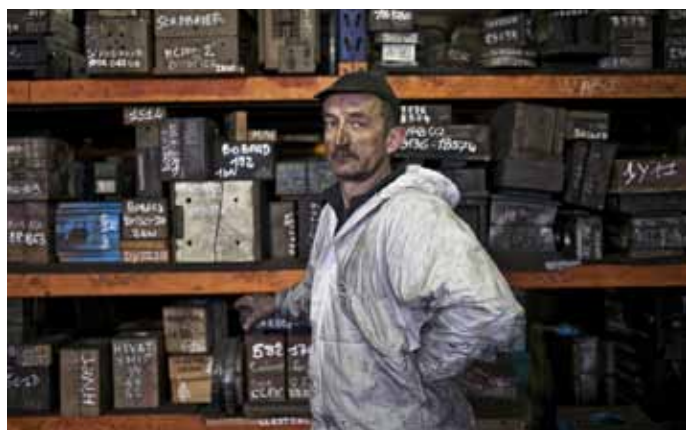
■ Les invisibles, Bourgogne Fonderie, Châtillon-sur-Seine

Au cours de l'hiver 2015-2016, un autre aspect de l'histoire de la région vous sera présenté par le biais d'une exposition temporaire. La photographe contemporaine Claire Jachymiak retrace par ses images un épisode de l'histoire métallurgique du Châtillonnais.