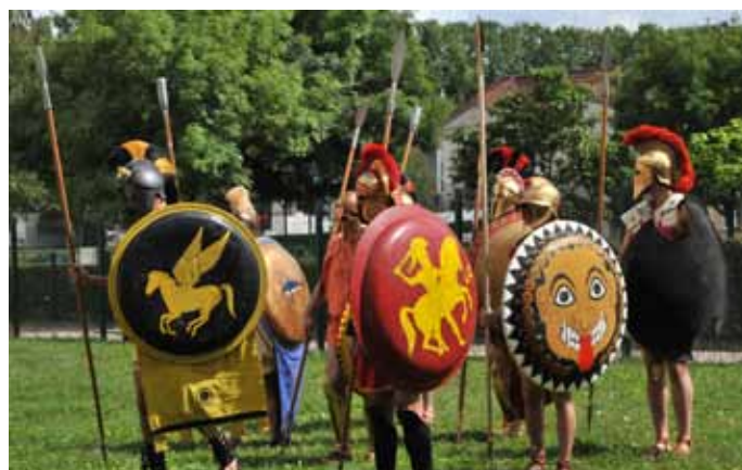
■ Hoplites en Galatie, des grecs chez la dame de Vix

Chaque année, le Musée du Pays Châtillonnais-Trésor de Vix propose de nombreuses animations pour les adultes et les enfants à vire seul ou en famille, le temps d'une heure, d'une demi-journée ou plus.