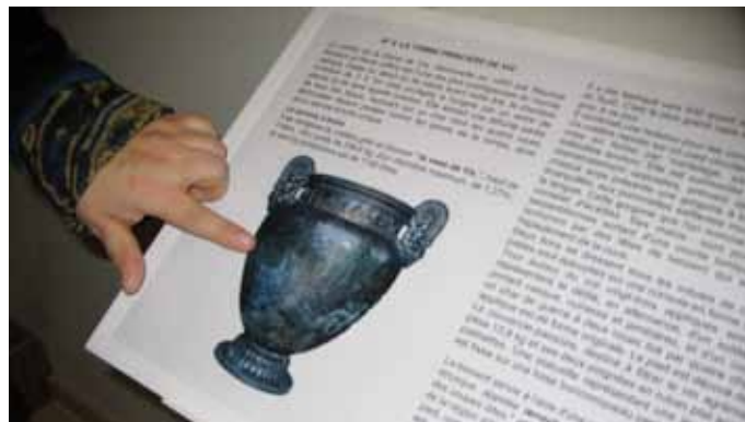
■ Feuille de salle en braille

Fauteuils roulants, guides et feuilles de salles en braille, vase en résine permettant l'exploration tactile, le Trésor de Vix est accessible aux personnes touchées par différents handicaps et ceci grâce à la participation de l'association des Amis du Musée du Pays Châtillonnais et ses partenaires, la Caisse d'Épargne et la Mutualité de Côte-d'Or-Yonne.