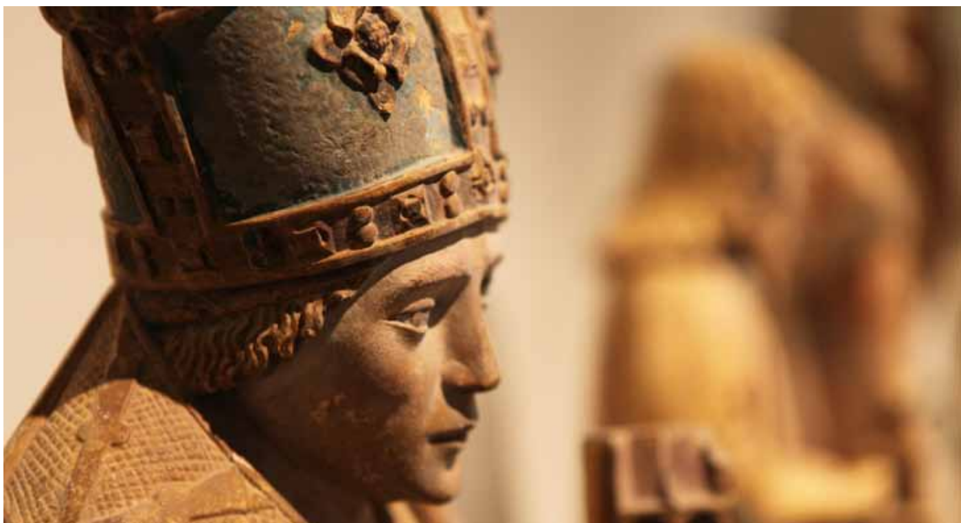
■ Ci-dessus : Saint Claude, évêque, pierre, 15 e siècle © Claire Jachymiak